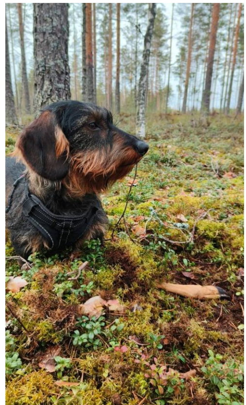
Kuvassa Wihinokan Ingolf "Valo" AVO2 38p